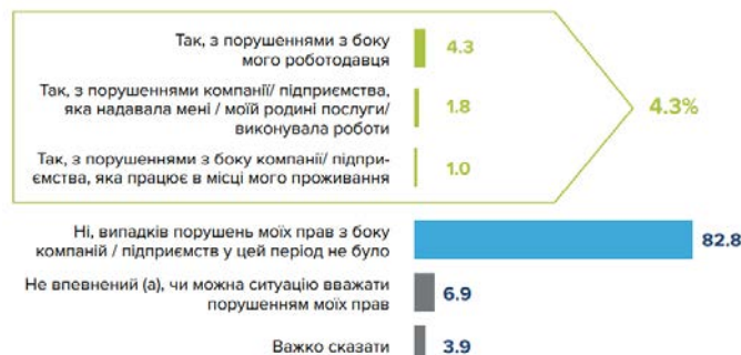
Рис. 3. Досвід порушення прав людини з боку підприємств після 24 лютого 2022-го року

Чи стикалися Ви з порушенням Ваших прав з боку компаній / підприємств після 24 лютого 2022 року? (респондент міг обрати декілька відповідей)