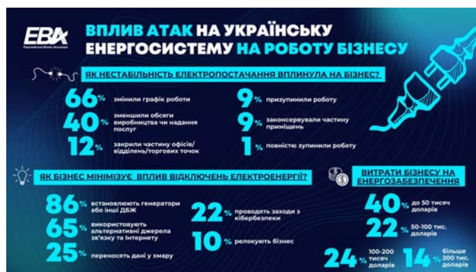
Рис. 1. Вплив ракетних ударів по енергетиці на бізнес в Україні

Нижче наведено дані про вплив ракетних ударів по енергетиці на бізнес в Україні.