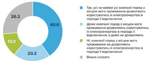
Рис. 2. Вплив відключень електроенергії та підтримку на період відключень

Скажіть, будь ласка, компанії поряд з місцем Вашого проживання (мова йде про супермаркети, магазини роздрібної торгівлі, поштові відділення, пункти видачі замовлень, кафе, ресторани тощо) дозволяють чи не дозволяють користуватись їх електроенергією в періоди її відключення? (% серед респондентів, які відчували вплив відключень електроенергії, n=1112)