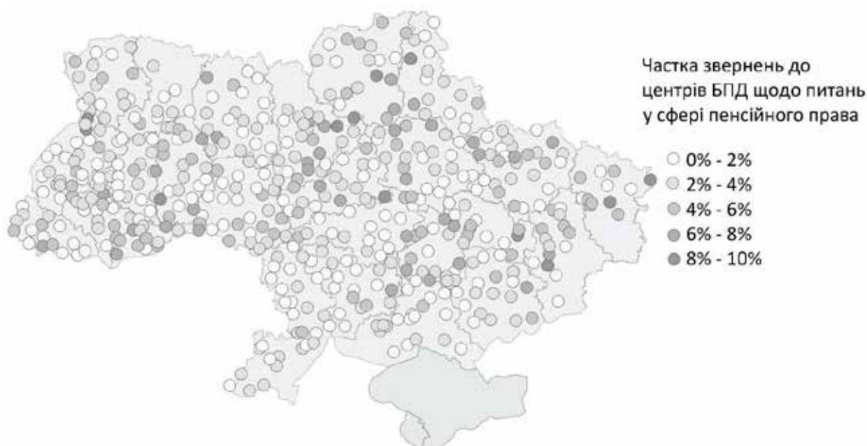
Рис. 5. Частка звернень до офісів БПД щодо питань у сфері пенсійного права (% від усіх звернень до центрів у відповідному населеному пункті)

Проблеми у сфері пенсійного права. Середня частка звернень до місцевих офісів із надання БПД щодо питань у сфері пенсійного права становить 3,4%, середньоквадратичне відхилення – 2,2%, мінімум – 0%, максимум – 10,2% (з урахуванням аутлаєрів – 56,4%). Візуальний аналіз свідчить про те, що пенсійні проблеми становлять відносно вищу частку звернень на півночі та сході Київської області, у Чернівецькій області, в окремих районах на межі Чернігівської та Сумської областей та на кордонах Дніпропетровської області тощо (Рисунок 5). Як і для попередніх категорій правових проблем, райони з низькою часткою звернень щодо пенсійних питань можуть знаходитися поруч із районами з високою часткою звернень. Порівняно вищий середній рівень цього показника (5–7%) спостерігається в Київській, Луганській, Чернівецькій областях та м. Києві, а порівняно нижчий (2%) – у Тернопільській, Рівненській і Одеській областях. Із часткою осіб віком від 60 років серед населення області 9 показник не корелює.