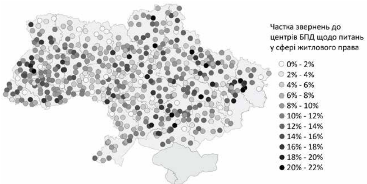
Рис. 1. Частка звернень до офісів БПД щодо питань у сфері житлового права (% від усіх звернень до офісів у відповідному населеному пункті)

Проблеми у сфері житлового права. Середня частка звернень до місцевих офісів із надання БПД щодо питань у сфері житлового права становить 9,7%, середньоквадратичне відхилення – 4,6%, мінімум – 0%, максимум – 22,3% (з урахуванням аутлаєрів – 31,5%). Візуальний аналіз вказує на наявність територій, де частка проблем у царині житлового права вища – наприклад, південний захід Луганської області та північ Донецької (території, що були окуповані та звільнені у 2014 р.), центральні райони Львівської області чи південь і центр Дніпропетровської області; та інші, де ця частка нижча, – наприклад, Полісся (північ Волинської, Рівненської, Житомирської областей) (рисунк 1).