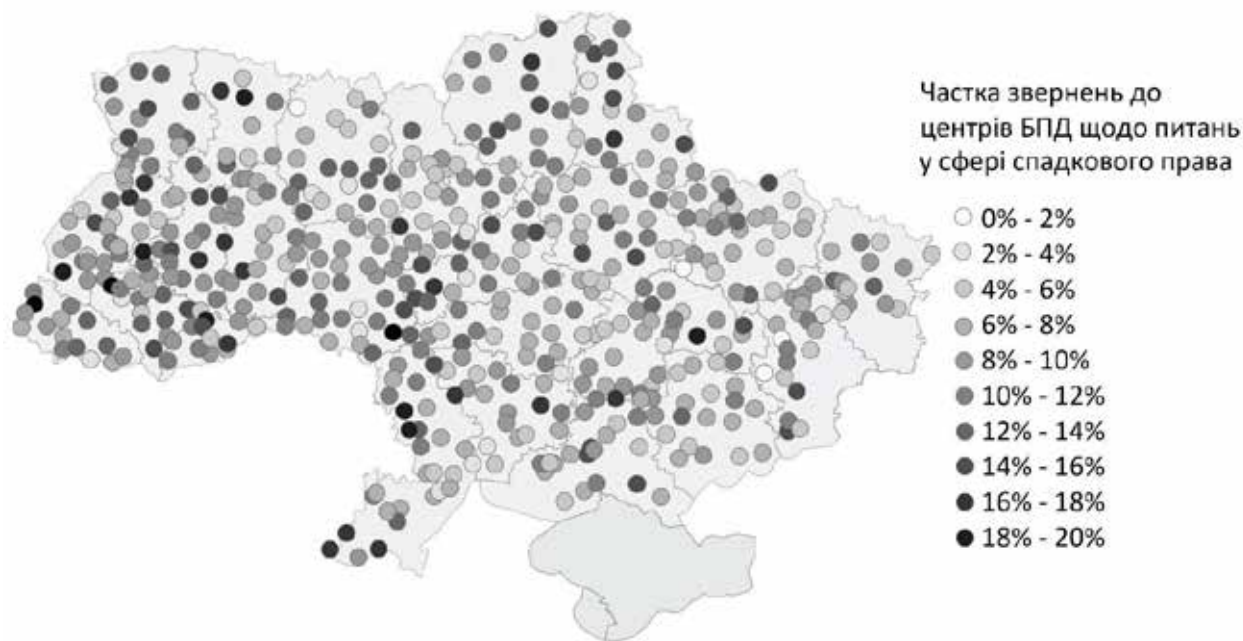
Рис. 3. Частка звернень до офісів БПД щодо питань у сфері спадкового права (% від усіх звернень до офісів у відповідному населеному пункті)

Вінницької та Черкаської областей, окремі райони в західних областях (Рисунок 3). Натомість у Києві, Одесі й околишніх районах або ж на півночі Житомирської області звернення зі спадкових питань порівняно менш поширені. Як і щодо питань земельного права, поширеність цих питань зростає зі сходу на захід. Райони з низькою часткою звернень щодо спадкових питань подекуди розташовані поруч із районами з високою часткою звернень. Порівняно вищий середній рівень цього показника (12%) спостерігається в Чернігівській, Івано-Франківській, Волинській областях, а порівняно нижчий (6–8%) – у Київській, Харківській, Донецькій, Запорізькій областях та м. Києві. Частка звернень щодо спадкових питань не корелює з коефіцієнтом смертності, але корелює із середнім розміром домогосподарства 8 в області, що може пояснюватися більшою кількістю спорів щодо спадку в разі наявності більшої кількості спадкоємців.