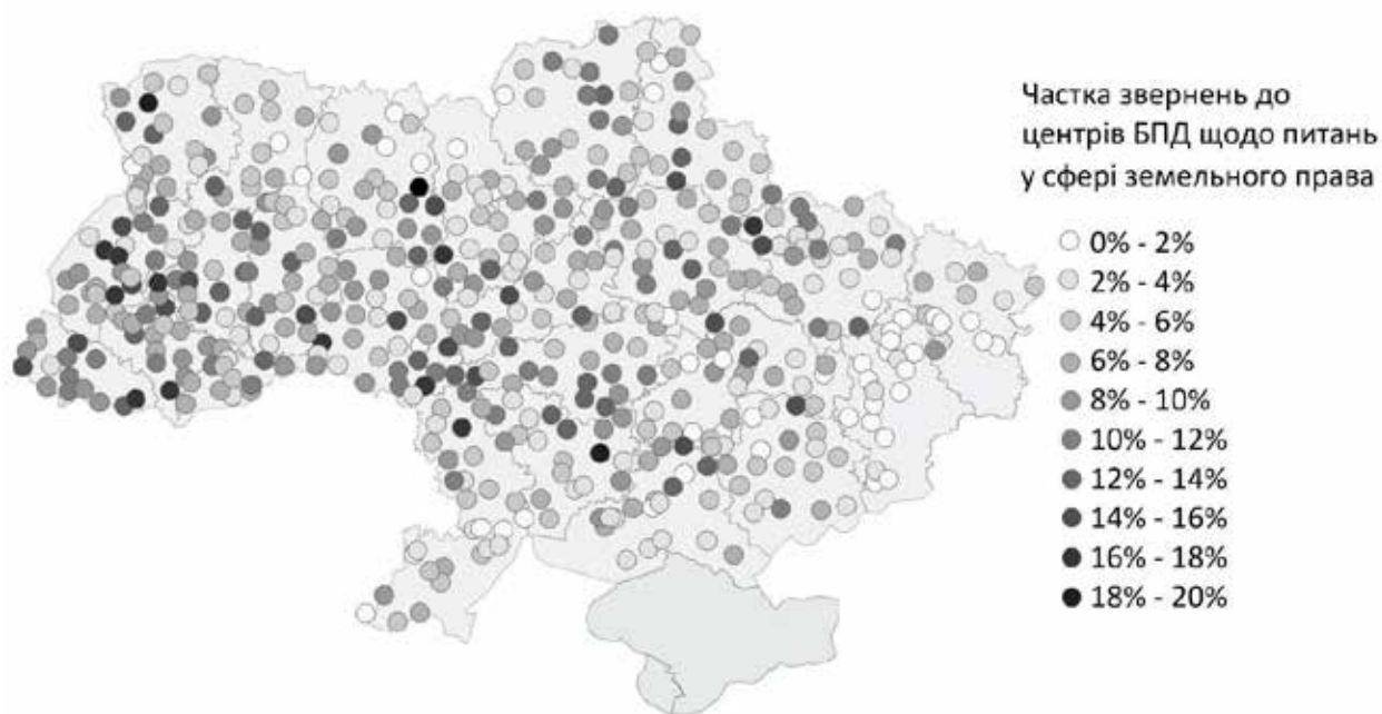
Рис. 2. Частка звернень до офісів БПД щодо питань у сфері земельного права (% від усіх звернень до офісів у відповідному населеному пункті)

Середня частка звернень щодо питань у сфері земельного права є найбільшою в західному та центральному регіонах і найменшою на Донбасі (Таблиця 5). Ця частка є нижчою в обласних центрах, ніж в інших населених пунктах області, але ступінь віддаленості району від облцентру суттєво не впливає на поширеність земельних проблем (Таблиця 6). Зі зростанням розміру населеного пункту зменшується середня частка звернень до офісів із надання БПД щодо земельних питань (Таблиця 7).