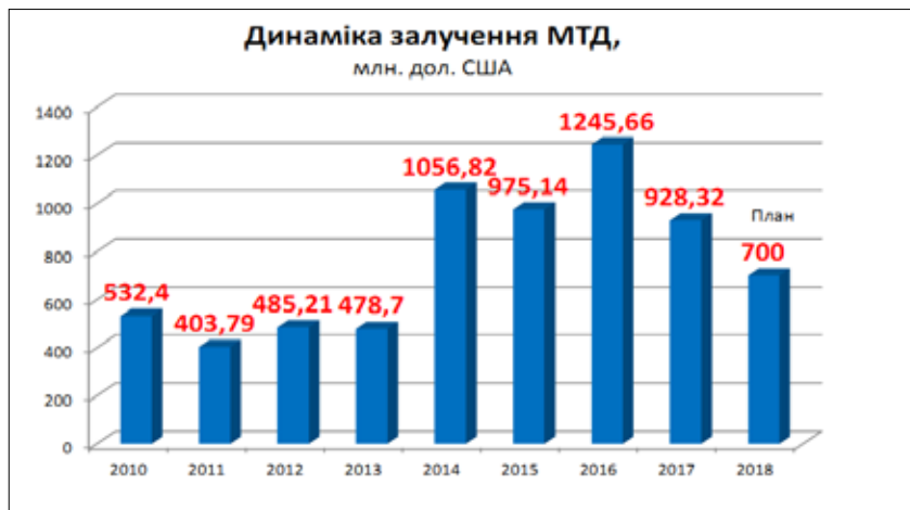
Діаг. 2. Динаміка залучення міжнародної технічної допомоги

3) підтримка реформ у сфері юстиції в Україні [21] – проект, що надає допомогу в розробленні загальної стратегії реформ сектору юстиції. Ця ініціатива об'єднує більшість установ сфери правосуддя України для того, щоб розробити і впровадити загальну і колективну стратегію реформ;